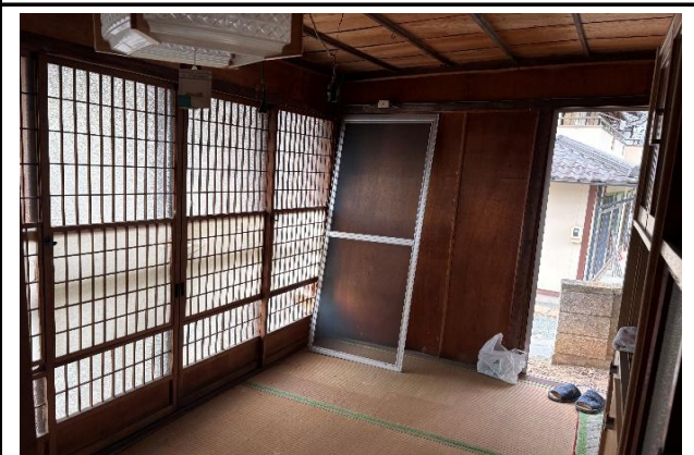
キッチン南側の和室3畳