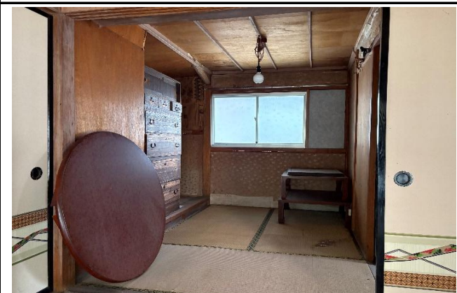
東側和室6畳の奥の和室3畳