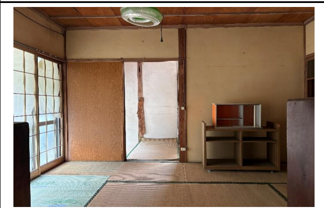
西側和室6畳から玄関