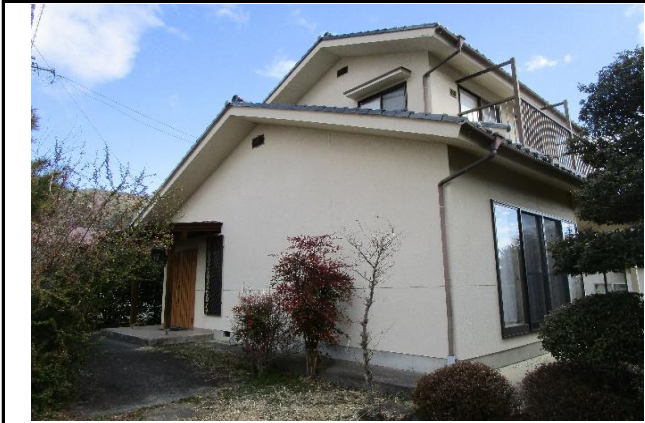
外観 西側より撮影