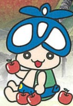
青木村マスコットキャラクター 「アオキノコ」ちゃん