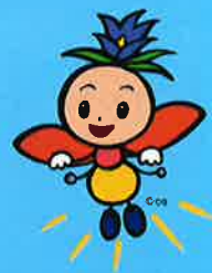
長野県選挙啓発 マスコットキャラクター 「ほたりちゃん」

やあ！私はホタリちゃん 今日は みんな と選挙や政治について考えにきたよ！ 「選挙」は私たちの暮らしや社会をよりよくするための「政治」を行う代表者を私たち自身が決めるとても大事なことなんだ。みんなは選挙や政治に興味はあるかな？