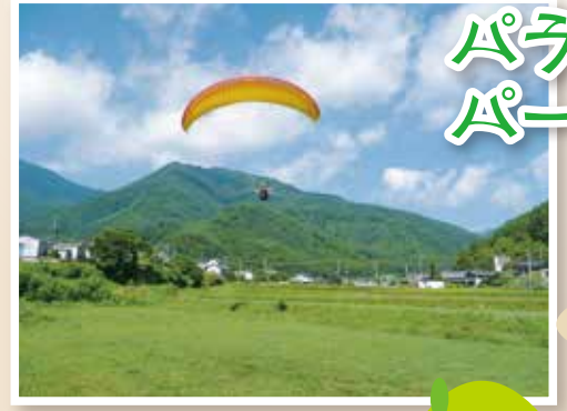
パラグライダー パーク青木