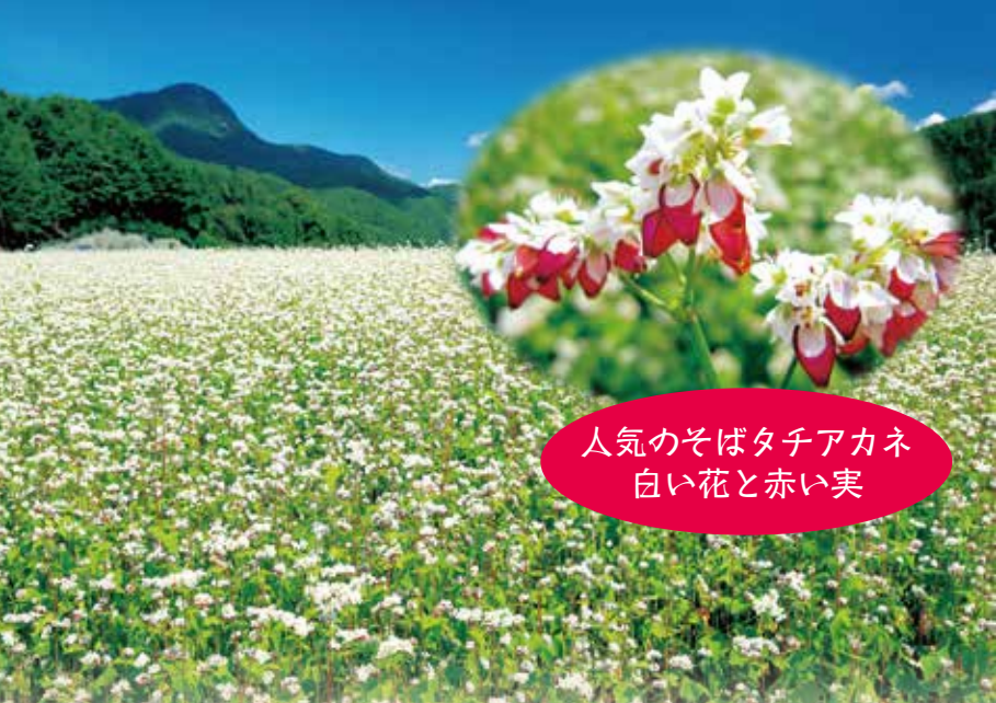
人気のそばタチアカネ 白い花と赤い実