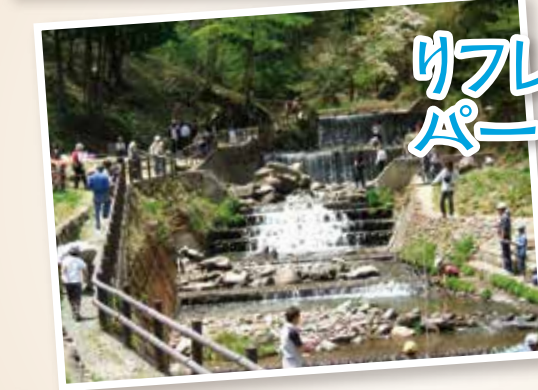
リフレッシュ パークあおき