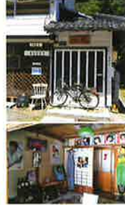
図 11:30～14:00 夜の部 月曜日～木曜日 夜は相談により営業 〒青木村大字田沢2627 ☎090-1828-4684

おすすめ 見学だけでもOKです。 気軽にお立ちよりにください。 河合奈保子ファン特典あり