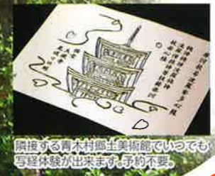
隣接する青木村郷土美術館にいつでも写経体験が出来ます。予約不要。