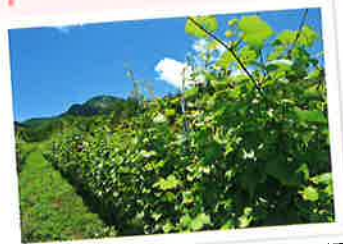
子檀嶺山麓に広がるぶどう畑 「ファンキーシャトー」