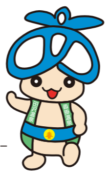
青木村マスコットキャラクター「アオキノコ」ちゃん