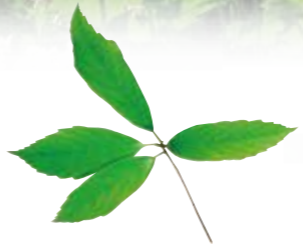
タチアカネそば (青木村限定栽培)