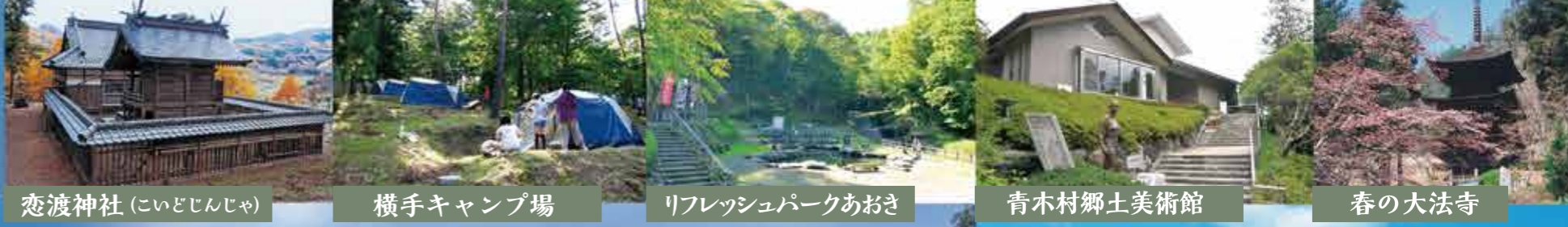
恋渡神社 (こいどじんじや)