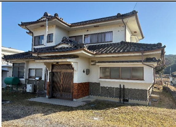
外観 北側から撮影