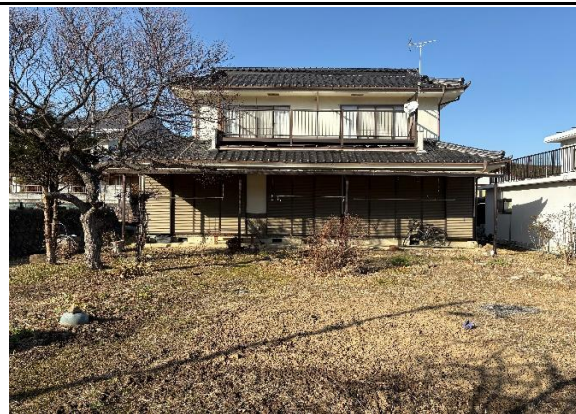
外観 南側から撮影