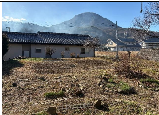
広々とした家庭菜園