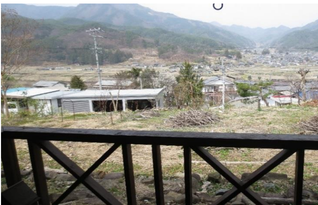
ウッドテラスからの景色