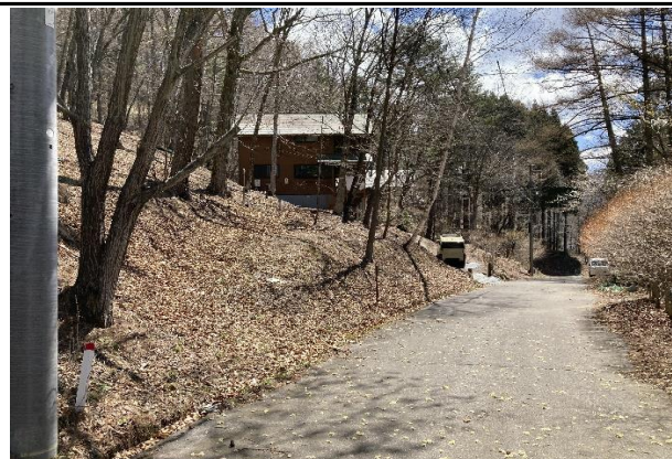
前面道路からのアプローチ