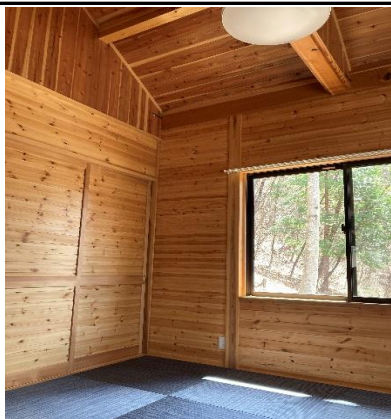
開放感のある和室