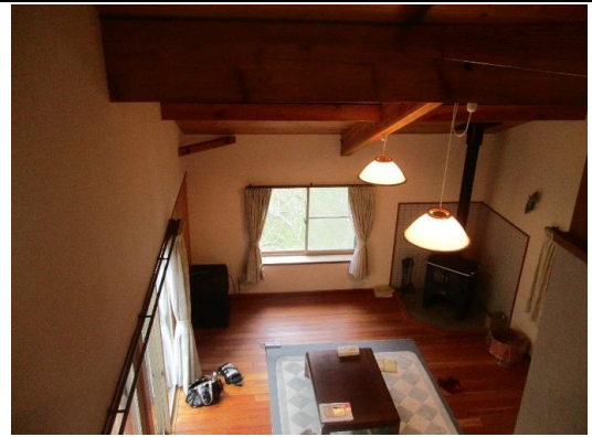
二階からのリビング