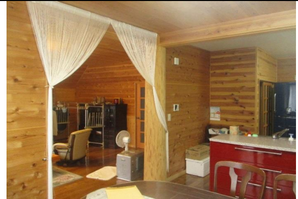
キッチンからリビングルーム