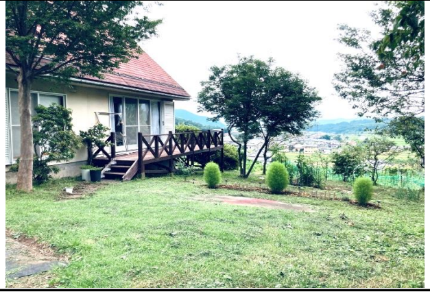
家庭菜園が楽しめる庭