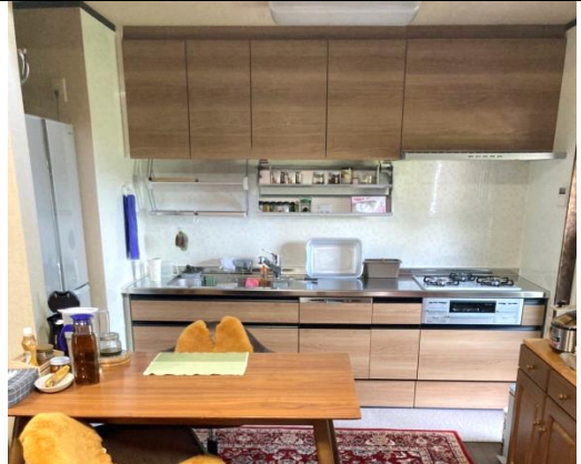
広々としたキッチン