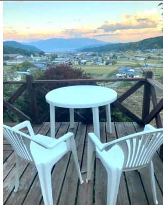
テラスからの眺望