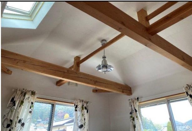
2Fは天窓もあり明るい空間となっている