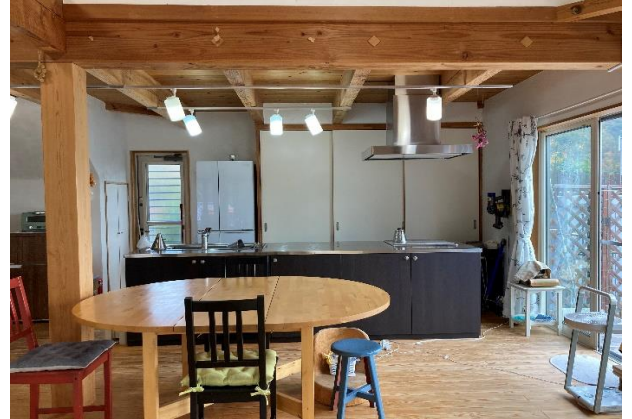
広々としたアイランドキッチン