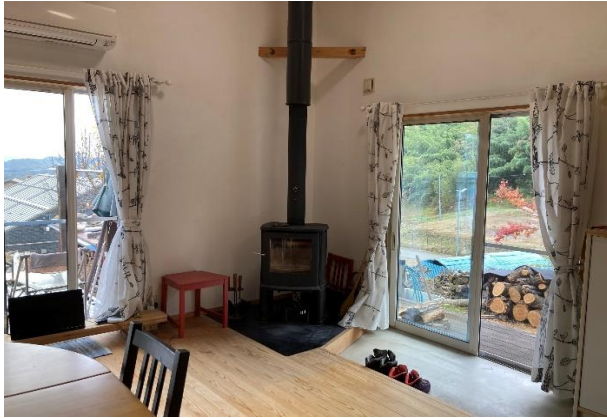
リビングには薪ストーブが設置されている