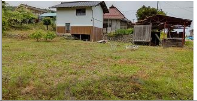
建物西側（物置・畑あり）