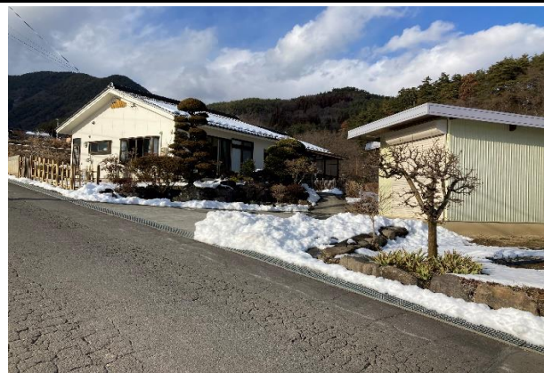
前面道路から撮影