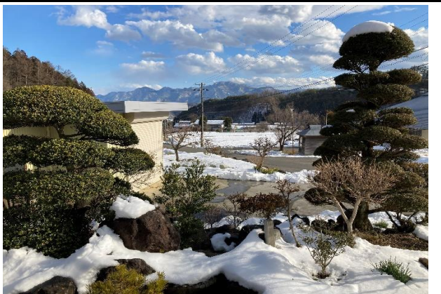
リビングからの眺め