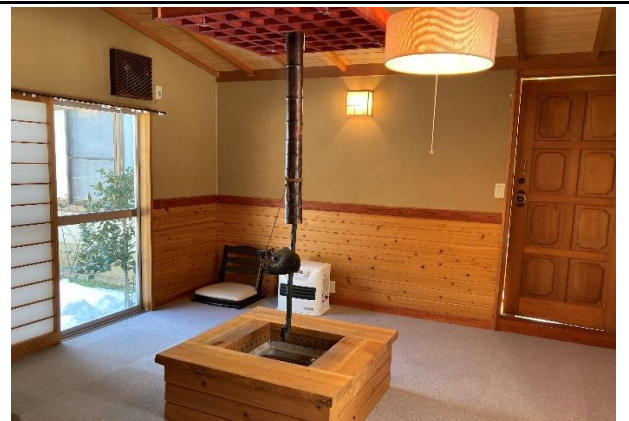
増築部分には囲炉裏が設置されている