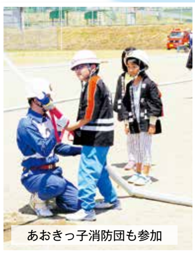
あおきっ子消防団も参加