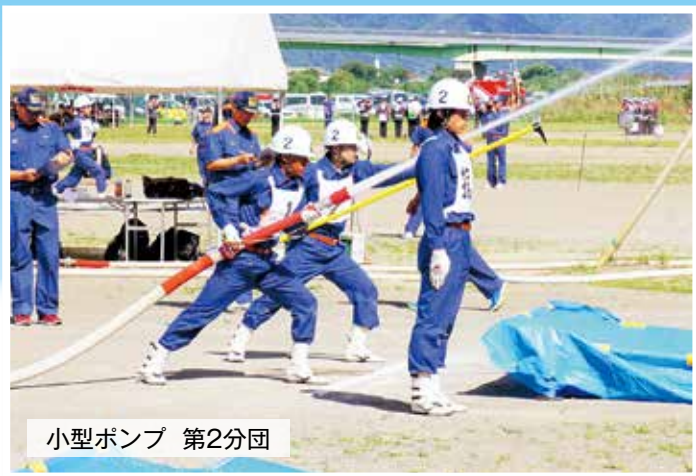
小型ポンプ 第2分団