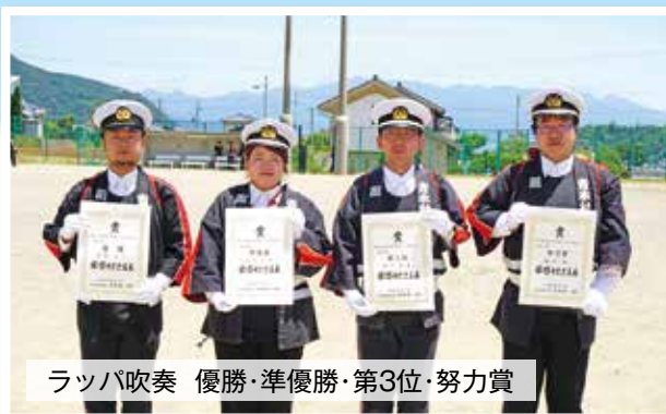
ラッパ吹奏 優勝・準優勝・第3位・努力賞