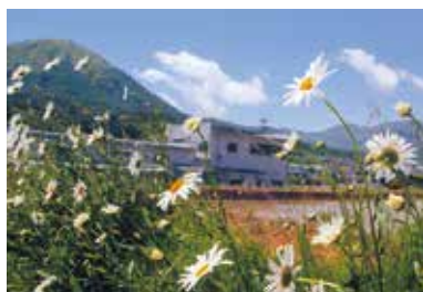
「はなはな」 (2018年6月撮影)

2018年版カレンダー作成では、多くの皆様にご応募いただきありがとうございます。今回も2019年度版青木村オリジナルカレンダーに掲載する写真【風景・祭・行事・特産品など】を広く募集いたします。詳しい募集要項は役場・農産物直売所・文化会館等に置いてある募集要項をご覧ください。