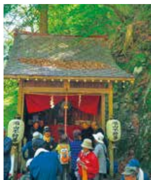
「瀧山不動尊祭り」 撮影者：西澤 豊 (2018年5月撮影)