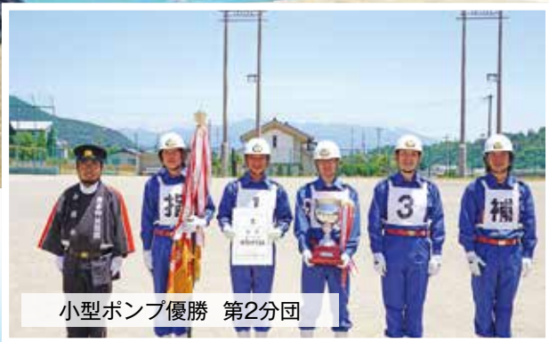
小型ポンプ優勝 第2分団