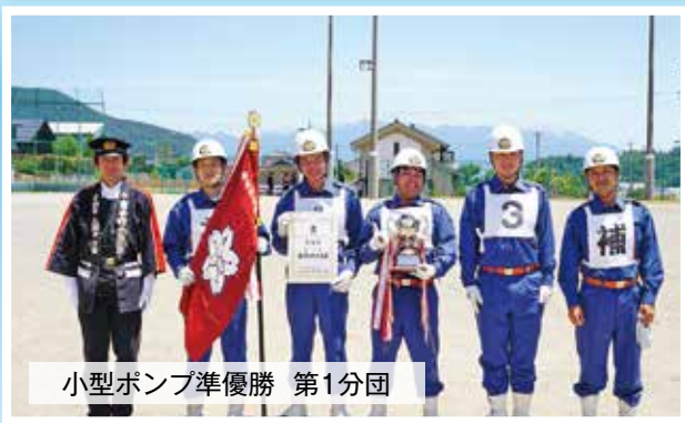
小型ポンプ準優勝 第1分団